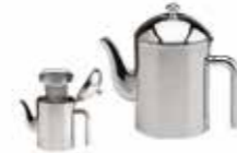
Teekanne, doppelwandig Tea pot, double-walled