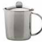
Kaffeekanne Coffee pot Profile