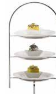
Universalständer Multi purpose stand

für Teller for plates Ø 21 cm 12.2078.0000