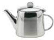
Teekanne Tea pot Profile