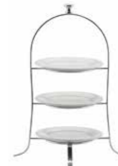
Universalständer Multi purpose stand Excellent

für Teller for plates Ø 24 cm 12.2078.2400