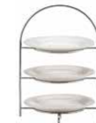
Universalständer Multi purpose stand

für Teller for plates Ø 21 cm 12.4178.0000